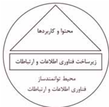
شکل ۲- هسته مرکزی مدل کلان چارچوب توسعه پارک‌های مجازی در ایران

سایبرنتیکی ۱۱ (قانون مربوط به فضاهای مجازی)، مقررات و خط مشی‌ها، توسعه مناطق دورافتاده و حاشیه نشینان، عدالت دیجیتال و جلوگیری از تبعیض دیجیتال، سرمایه‌گذاری و تجارت، برنامه‌ریزی و اداره امور فناوری اطلاعات و ارتباطات، توسعه منابع انسانی، ایجاد ظرفیت و جامعه الکترونیکی. در این زمینه «پورتال ملی ایران» ۱۲ - که به تازگی راه‌اندازی شده - نیز به مرور که توسعه یافته و تقویت می‌شود، می‌تواند گزینه خوبی برای بهره‌برداری باشد.